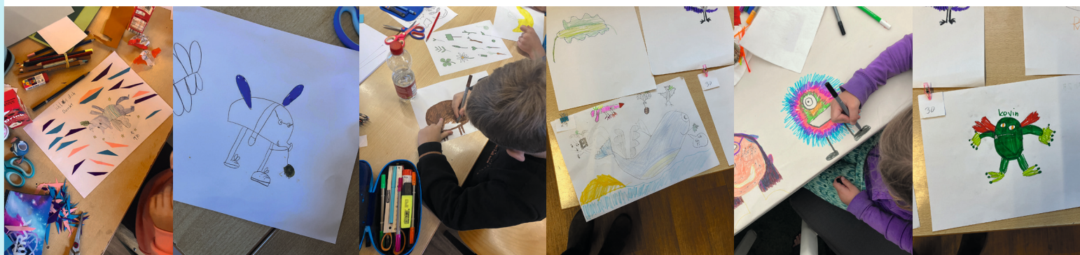
Abbildungen: Friedenstier Workshop in Greifswald